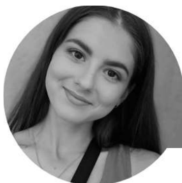
Интервью брала: Юлия Лушников

Хочу сказать одно - всё будет хорошо! Главное не унывать и находить время на отдых даже в условиях самоизоляции!