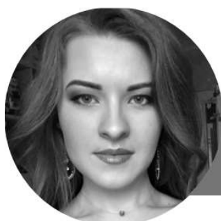
Интервью брала: Наталия Совина

И сейчас для меня факультет – это прежде всего люди. Люди, с которыми хочется быть.